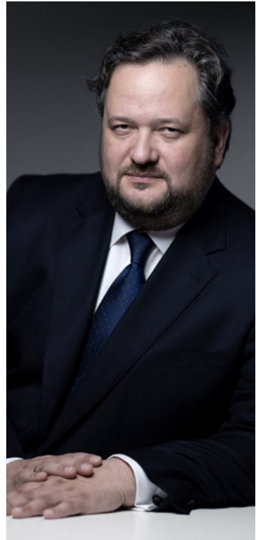
Directeur général Président de la Fondation d'entreprise Société Générale