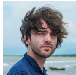
Boyan SLAT Fondateur et Directeur général de The Ocean Cleanup

Les années à venir sont décisives. Nous accélérons activement pour atteindre notre objectif ambitieux de stopper jusqu’à un tiers de l’ensemble des émissions de plastiques provenant des rivières vers l’océan d’ici 2030, en déployant nos solutions dans certains des centres urbains les plus polluants au monde. Ce programme amplifie nos efforts de dépollution, déjà leaders à l’échelle mondiale, à une dimension inédite. Le défi est immense, mais l’opportunité l’est tout autant.